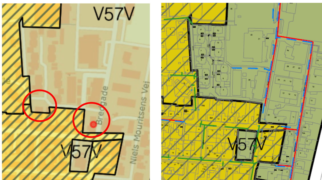
Fig. 2. Nuværende spildevandsplanlægning (venstre) og kommende spildevandsplanlægning (højre).

I tillægget er der samtidigt foretaget en tilretning af opland V05V, så oplandet følger matrikelgrænsen for matr.nr. 21 Pugdall Gde., Vildbjerg. Ændringerne har ingen betydning for de respektive recipienter, da spildevandsplanen udelukkende ændres, så den viser de faktiske forhold.