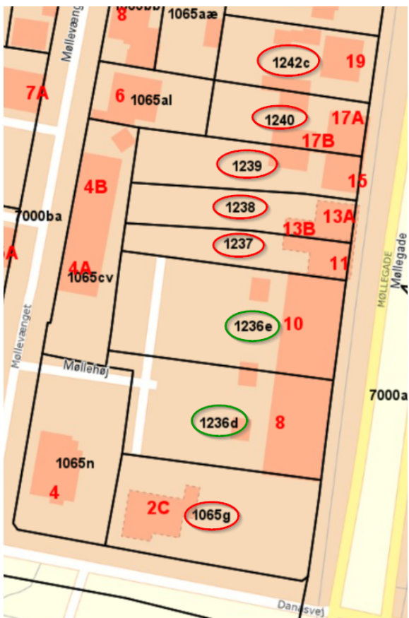
Figur 1. Matrikler med privat kloak: To af matriklerne er kloakeret i dag (grøn markering). Den private kloak er forberedt til at yderligere seks matrikler (rød markering) kan slutes på.