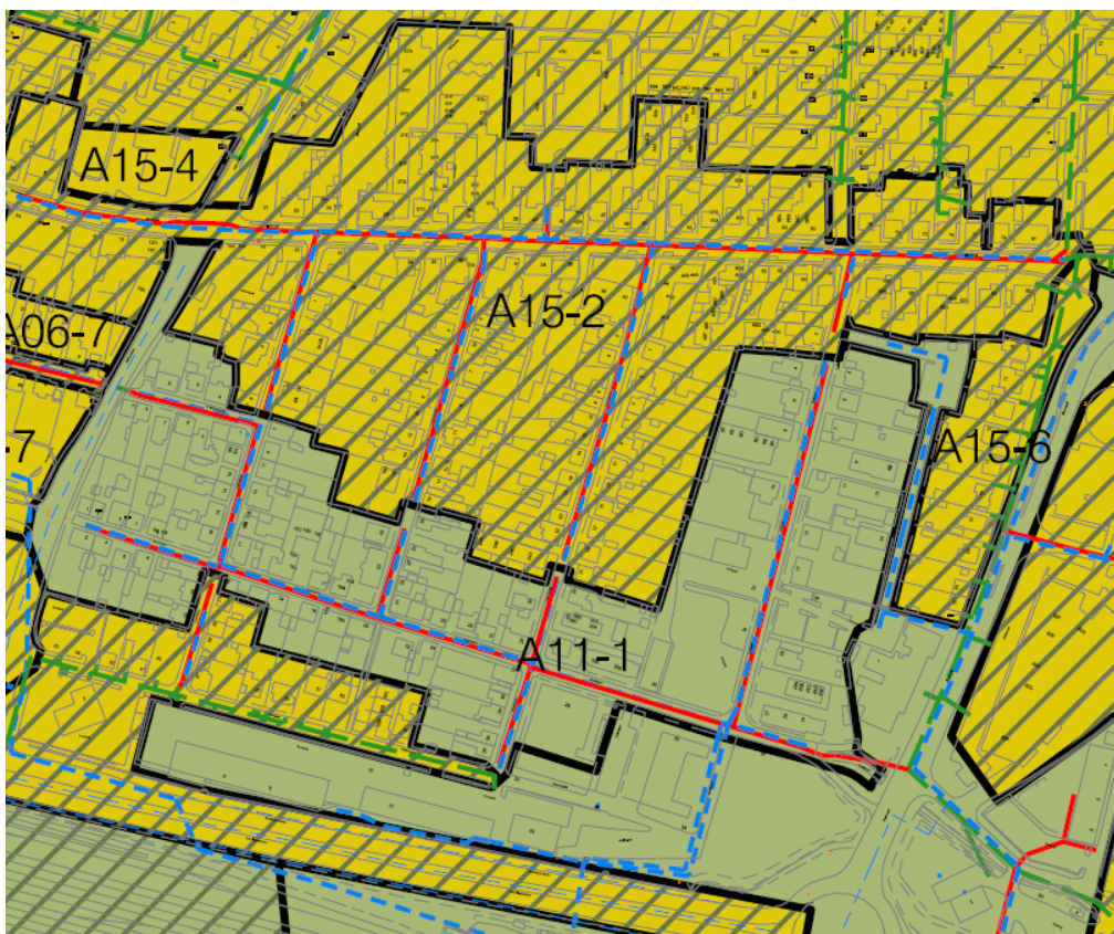
Kortudsnit viser del af Silkeborgvej, 7400 Herning – fremtidige forhold.