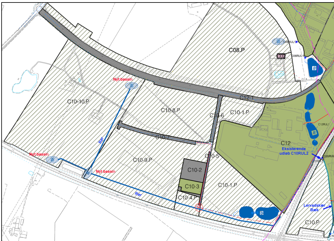
Ændrede oplande og nye bassiner med rørledninger