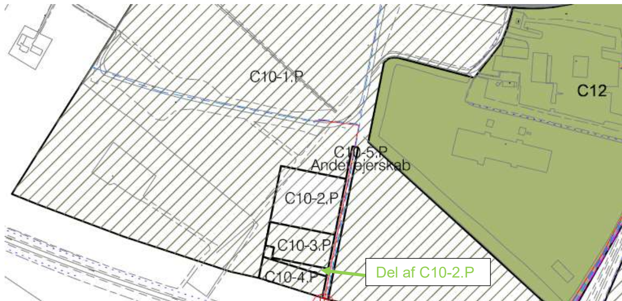
Figur 2. Nye spildevandsoplande i området ved Mørup Syd