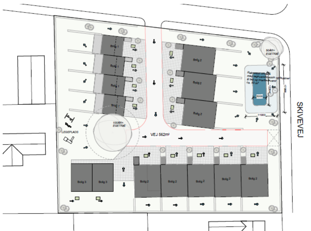
Skitse med den planlagte udstykning inkl. areal til håndtering af regnvand: hverdagsregn fra veje og indkørsler ledes til bassin (mørkeblå markering). Skybrudsregn håndteres i lavning omkring bassinet (lyseblå markering)