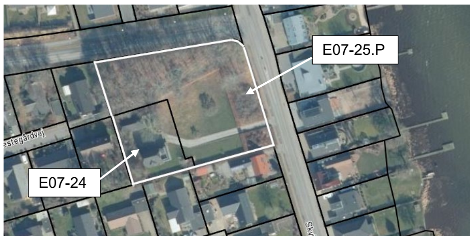
Luftfoto med markering af det nye boligområde (hvid markering), som dækker matr. 1ak og 1xk, Sunds Præstegård, Sunds, og indføres i spildevandsplanen som opland E07-24 og E07-25.P.

På baggrund af resultaterne har Herning Kommune besluttet at følge strategien i spildevandsplanen om, at alt overfladevand i området nedsives.