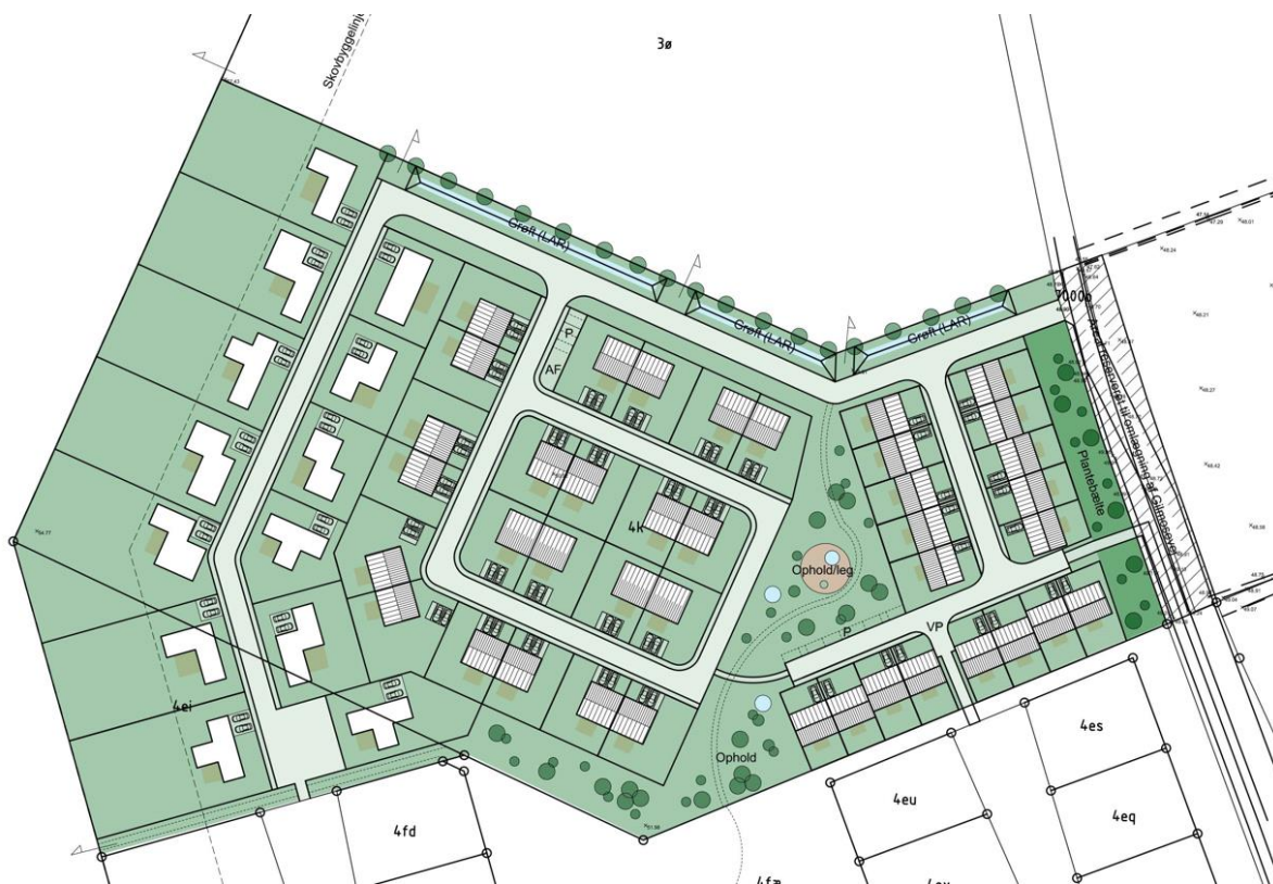
Skitse med den planlagte udstykning i lokalplanområdet med grøfterne placeret mod nord langs lokalplangrænsen.

I forbindelse med etablering af et fælles privat spildevandslav er der et sæt vedtægter, som hver matrikel forpligtiger sig til at overholde. Vedtægterne indeholder oplysninger om f.eks. medlemmer af lavet, kontingent, drift- og vedligeholdelsesforanstaltninger og lignende vilkår. Spildevandslavets vedtægter skal tinglyses på de matrikler, der afleder til anlægget og hvis ejere derfor er medlemmer i spildevandslavet (se udkast til vedtægter i bilag 1.4).